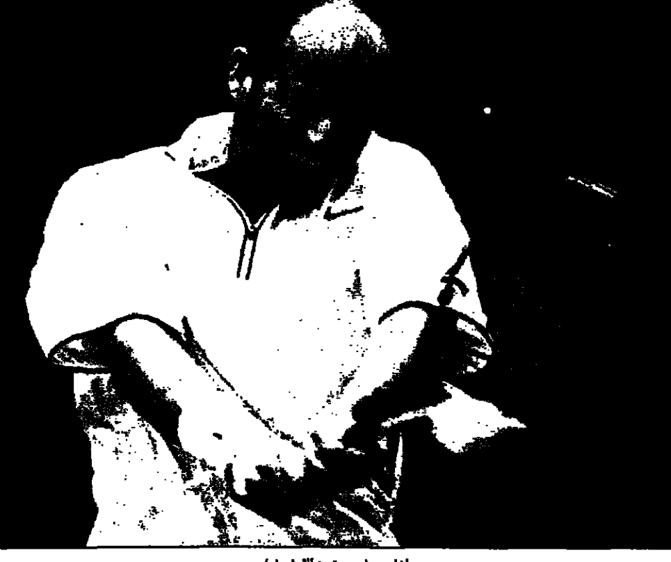
الغسي (سورة من الازيف)

بيروت - من يوسف حمادة: امين الاتحاد اللبناني لكرة القدم مهدي المصطفى اعترافا من اليوم الثلاثاء وحتى 27 للحل في تصفيات دور غرب اسيا في كرة اليد للبطولة التي بطولة العالم للكرة للهوكي في مصر من 1 الى 15 في بيروت (يونيو) للقب بمشاركة منتخب لبنان والاردن والجزيرة والكويت والسعودية.